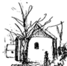
Sundby Kirke Skolebakken 69, Sundby 7950 Erslev

Oplysninger om kirkerne kan man få på: www.flade-bjergby-sundby-skallerup-kirker.dk