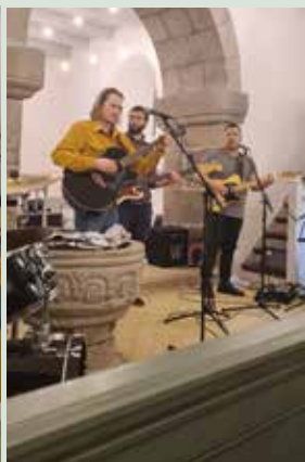
Koncert i Sundby