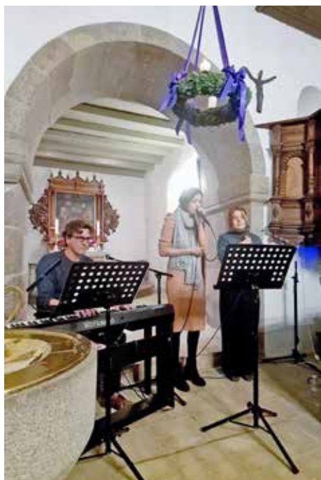
Adventskoncert i Flade