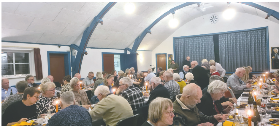
En festlig Mortens aften i Flade forsamlingshus