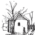
Sundby Kirke Skolebakken 69, Sundby 7950 Erslev

Oplysninger om kirkerne kan man få på: www.flade-bjergby-sundby-skallerup-kirker.dk