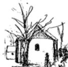
Sundby kirke Skolebakken 69, Sundby 7950 Erslev

Oplysninger om kirkerne kan man få på: www.flade-bjergby-sundby-skallerup-kirker.dk